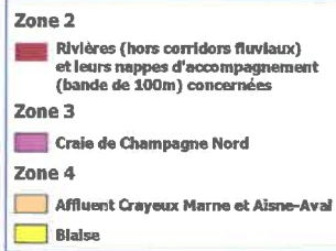
Zones de restrictions agricoles (A.P. Cadre 2022)